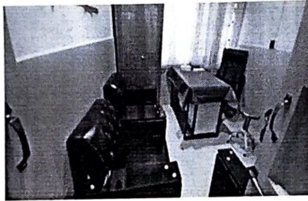
BHU Gulshan Rehman: Revamped MO Room